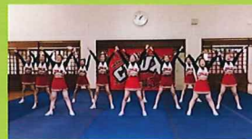
東京都立東大和南高等学校 チアリーディング部 CRUX