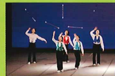
HYBC (東大和バトクラブ)