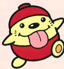
東大和市観光キャラクター うまベネ

午後の部は、4チーム対抗の運動会を実施するべえ〜 1位のチームには、素敵な景品をご用意しているべえ〜